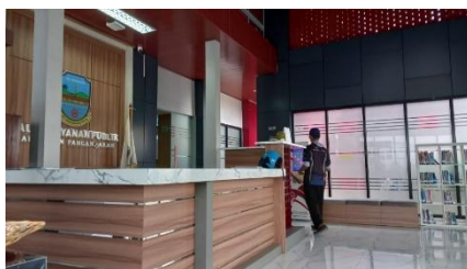
Gambar 2 : Reptosinis Mal Pelayanan Publik Kabupaten Pangandaran

Dari hasil observasi dapat dijelaskan bahwa mengenai lingkungan intern pada Mal Pelayanan Publik Kabupaten belum optimal karena Sumber Daya Manusia pada Mal Pelayanan Publik Kabupaten Pangandaran belum memenuhi kapasitas yang ingin dicapai oleh pihak Mal Pelayanan Publik dan Dinas Penanaman Modal dan Pelayanan Terpadu Satu Pintu. Dan hal itu dapat disebabkan karena kurangnya keterampilan yang cukup dalam melakukan oprasional yang optimal, dan hal tersebut dapat mempengaruhi keefesiensian kualitas pelayanan yang diberikan kepada masyarakat.