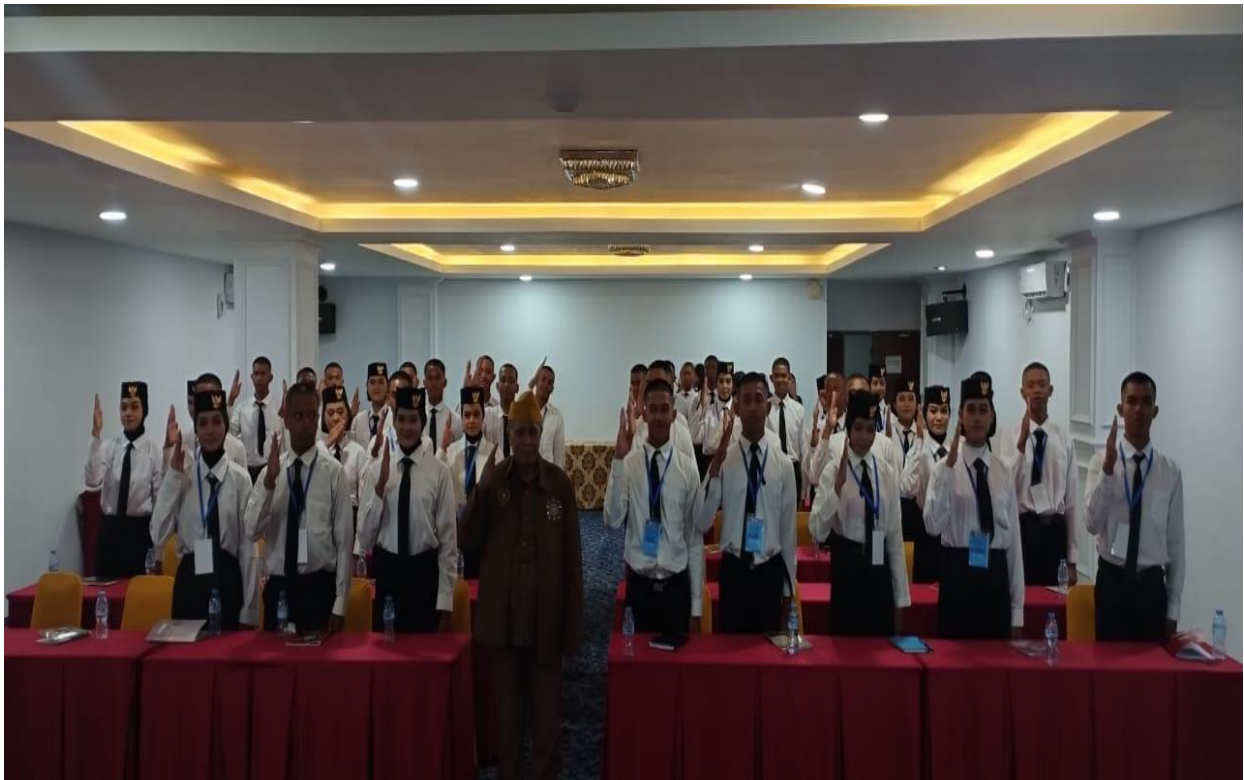
Gambar 4 Foto bersama Penyaji dan Peserta Kegiatan

Setelah kegiatan pemaparan materi, tanya jawab dan diskusi selesai, kegiatan diakhiri dengan berforo bersama yang menandakan bahwa kegiatan pelaksanaan ini telah berakhir dan diharapkan menjadi bekal bagi peserta (Anggota Paskibraka Tingkat Provinsi Sulawesi Tenggara Tahun 2025) untuk meningkatnya kesadaran akan nasionalisme dan semangat kebangsaan dan dapat menularkan dalam bentuk kehidupan mereka sehari-hari untuk mengisi kemerdekaan ini dengan segala tindakan positif, nyata dan berkontribusi bagi Negara ini.