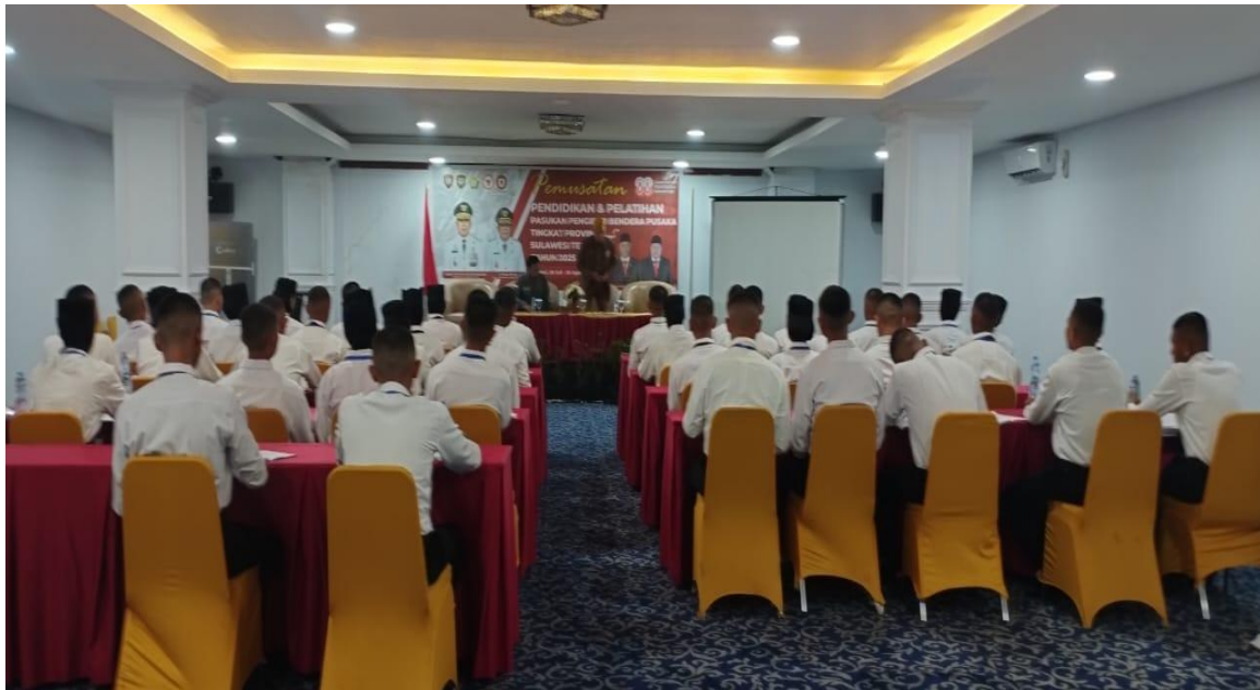
Gambar 3 Kegiatan Sosialisasi

Berdasarkan hasil kuisioner yang dibagikan kepada peserta terkait pemahaman mereka sebelum dan sesudah menerima materi terlihat perbedaan cukup signifikan terkait semangat kebangsaan dan rasa nasionalisme yang diuraikan pada Tabel 1 berikut