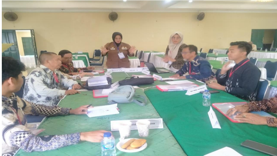
Gambar 4 Situasi Diskusi Kelas