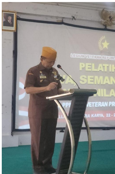
Gambar 2 Salah satu pemateri sosialisasi

Adapun materi beserta pemateri akan diuraikan dalam tabel 1 berikut