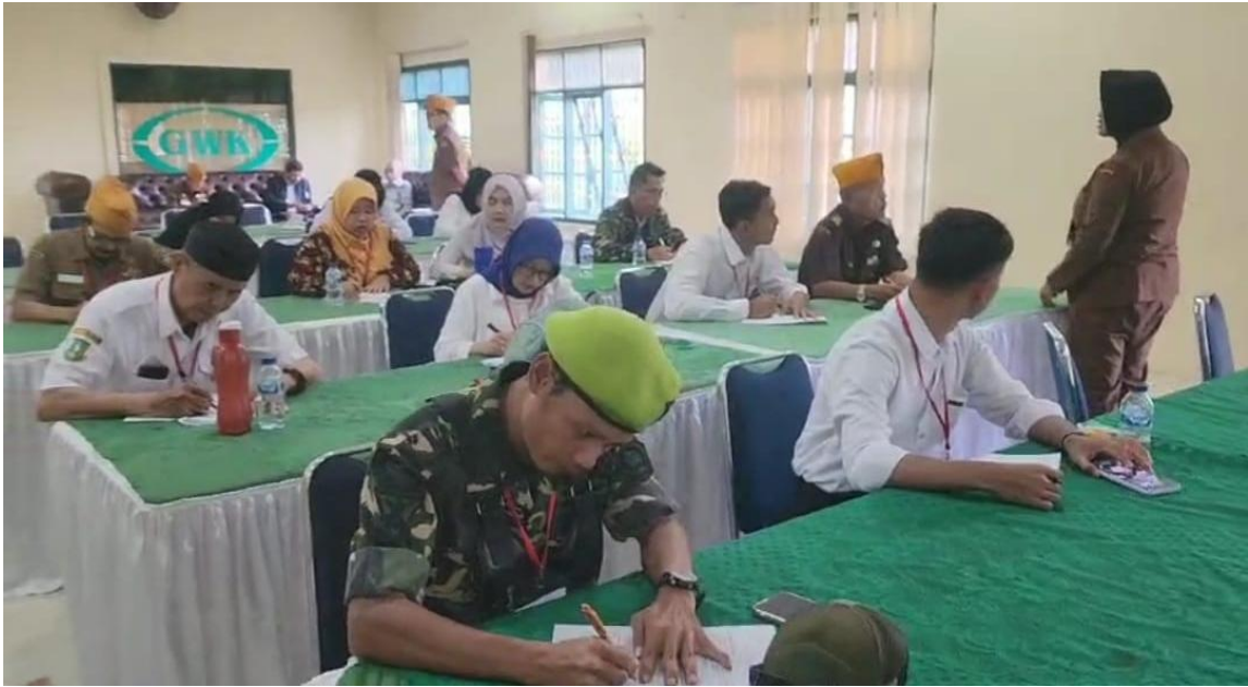
Gambar 3 Suasana ketika penyampaian Materi

bahwa untuk menjaga keutuhan bangsa, generasi muda harus peka dan tanggap terhadap isu-isu strategis.