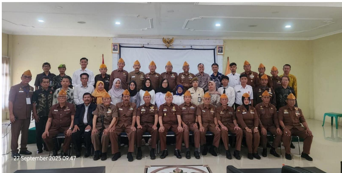
Gambar 5 Foto bersama Penyaji dan Peserta Kegiatan

Setelah kegiatan pemaparan materi, tanya jawab dan diskusi selesai, kegiatan diakhiri dengan berfoto bersama yang menandakan bahwa kegiatan pelaksanaan ini telah berakhir dan diharapkan menjadi bekal bagi peserta (untuk meningkatnya kesadaran akan nasionalisme dan semangat kebangsaan dan dapat menularkan dalam bentuk kehidupan mereka sehari-hari untuk mengisi kemerdekaan ini dengan segala tindakan positif, nyata dan berkontribusi bagi negara ini.