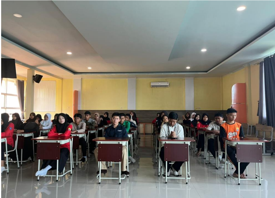
Gambar 3 Peserta Sosialisasi

Sebelum sosialisasi, sebagian besar peserta sudah memahami Pancasila dan UUD 1945 sebagai pedoman berbangsa dan bernegara, namun setelah kegiatan, seluruh peserta menunjukkan pemahaman yang lebih kuat dan aplikatif. Hal ini menunjukkan bahwa kegiatan sosialisasi tidak hanya memperkuat aspek kognitif, tetapi juga mendorong internalisasi nilai-nilai dasar negara ke dalam perilaku sehari-hari (Fernandez et al., 2025; Saryono et al., 2024). Penguatan ini penting agar nilai-nilai Pancasila tetap menjadi fondasi moral dalam menghadapi perubahan sosial dan tantangan global yang kompleks.