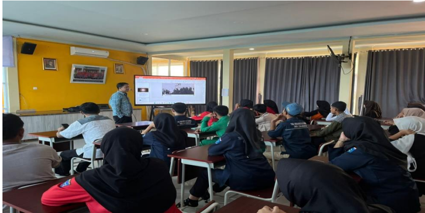
Gambar 2 Pemaparan Materi

Berdasarkan hasil kuesioner yang diberikan kepada para peserta, terdapat perbedaan yang cukup mencolok antara tingkat pemahaman mereka sebelum dan sesudah mengikuti kegiatan. Perbedaan tersebut tampak pada peningkatan semangat kebangsaan, rasa nasionalisme, serta pemahaman mengenai peran pejuang dan veteran dan kontribusinya terhadap negara. Data lengkap mengenai perubahan tingkat pemahaman peserta tersebut dapat dilihat pada Tabel 2 berikut.