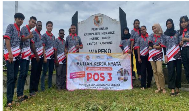
Gambar. 2 Dokumentasi Pembukaan KKN