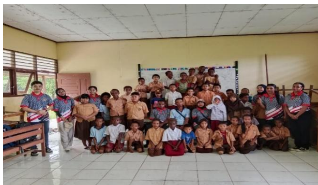
Gambar 4. Persiapan Kegiatan Senam Senang bersama Murid SD Negeri Wapeko

Setelah kegiatan ini berlangsung ada kegiatan lain yang diabawakan oleh anggota kelompok Kuliah Kerja Nyata (KKN) antara lainnya sosialisasi menabung sejak dini, seminar anti-bully (Badilla & Rado, 2022), pengenalan terhadap gadget dan dampaknya bagi anak dibawah umur, edukasi cinta lingkungan, dan belajar bahasa inggris dengan metode Vocabulary Flashcards . Semua kegiatan ini terlaksana akibat adanya kerja sama pengurus sekolah dan guru-guru serta murid Sekolah Dasar Negeri Wapeko. Antusiasme dan koordinasi menjadikan kegiatan berjalan dengan baik dan mulus.