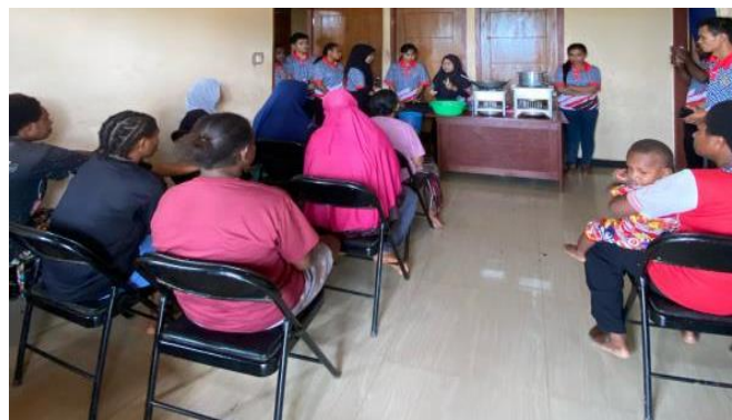
Gambar 5. Demonstrasi Masak Manisan Kelapa dan Kedondong

Walapun terlihat sepele olahan ini memiliki potensi jual diluar Wapeko ataupun bagi pendatang yang lewat untuk mengisi persediaan sebelum melanjutkan ke desa lain. Diharapkan demo masak ini dapat meningkatkan kegiatan UMKM.