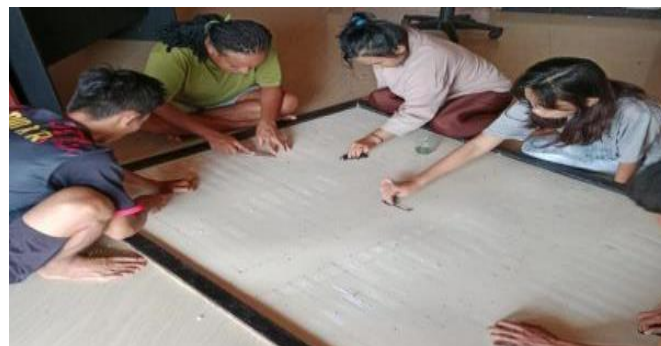
Gambar 3. Rehabilitasi Papan Informasi di Balai Desa

Pelaksanaan Kuliah Kerja Nyata merupakan salah satu bentuk penerapan Tridharma perguruan tinggi. Oleh karena tujuan KKN adalah untuk memastikan hubungan antara dunia akademik-teoritis dan dunia empiris-praktis (Fauzi et al., 2023). Kegiatan peningkatan fasilitas ini berupa pembersihan rerumputan liar, rehabilitasi papan informasi, hingga pemasangan piringan parabola kantor. Kegiatan ini didukung oleh aparat karena kegiatan Kuliah Kerja Nyata memberikan manfaat bagi aparat kampung sebagai peningkatan kenyamanan saat bertugas di kantor.